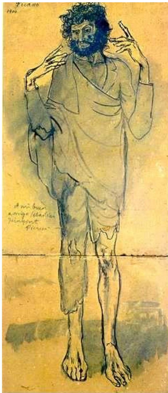
El Loco Pablo Picasso