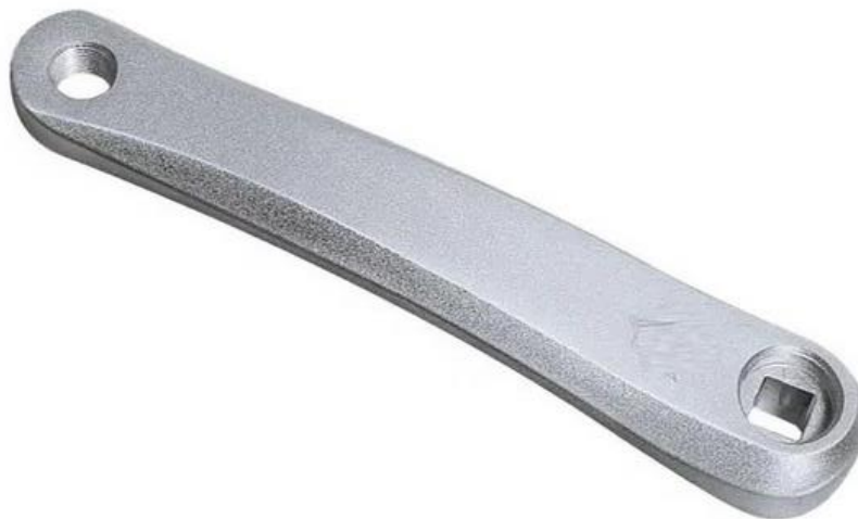
Figure N°2 : Manivelle de vélo réelle

On se propose dans cette première partie de reconstruire la maquette numérique d'une manivelle de vélo à partir de son modèle physique (figure N°2).