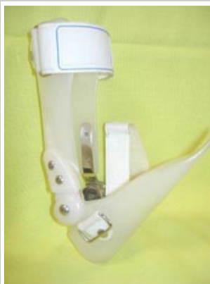
fig1 7.1_Orthèse_de_posture_suropédieuse - Copie.jpg