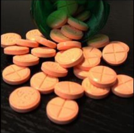
What society thinks it is.