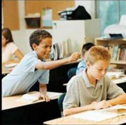
What my teachers think it is.