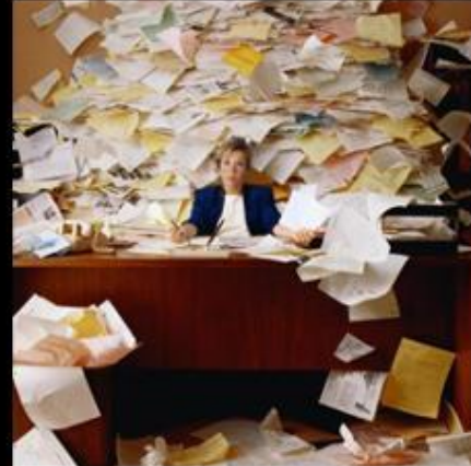
What my boss thinks it is.