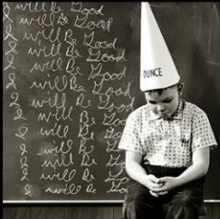
What my classmates think it is.