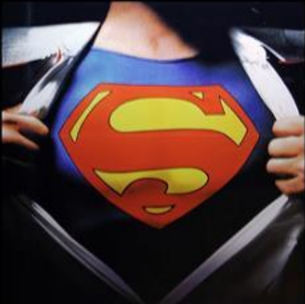
What I think it is.