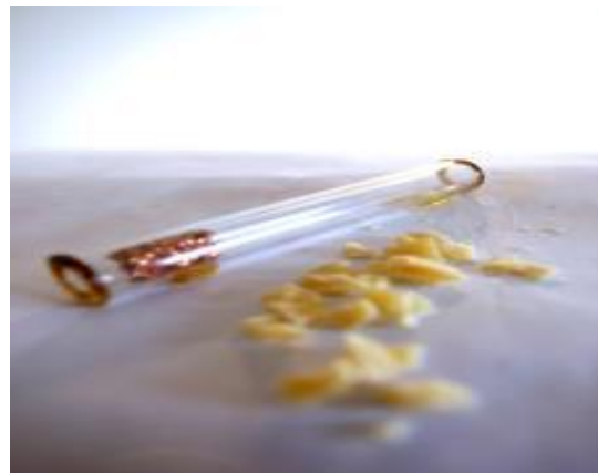
Crack / Freebase