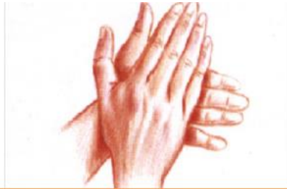
1 : Paume contre paume

Les 7 étapes d'une friction des mains avec un produit hydro-alcoolique.