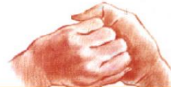
4 : Doigts et paume