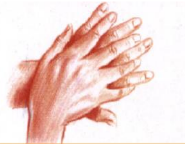
2 : Paume sur dos