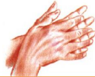
3 : Doigts entrelacés