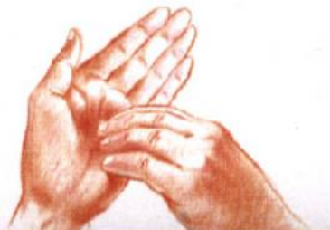
6 : Ongles