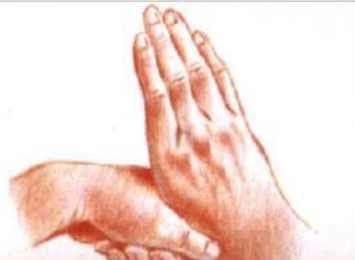
5 : Pouces et doigts