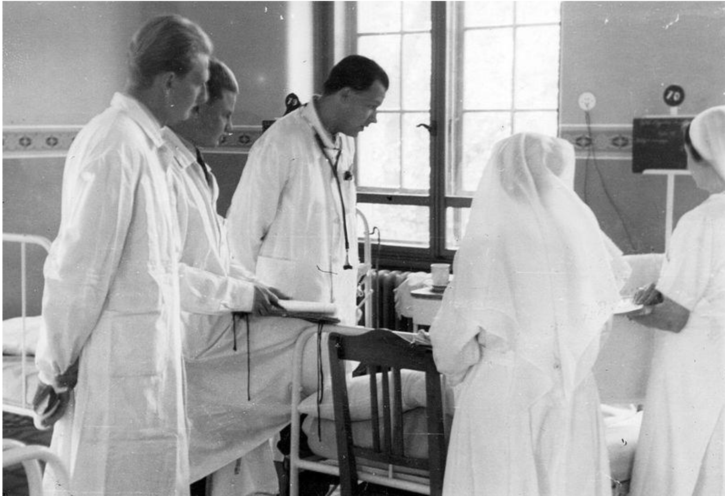
Médecins et infirmières au lit d'un malade, Hongrie, 1941