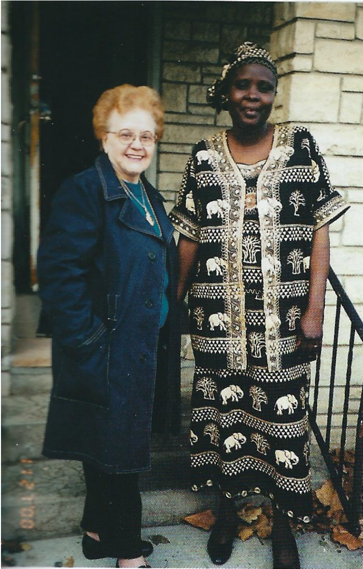
Leininger and Southern Sudanese refugee.

Madeleine Leininger (1925-2012), pionière des sciences infirmières et du Nursing transculturel