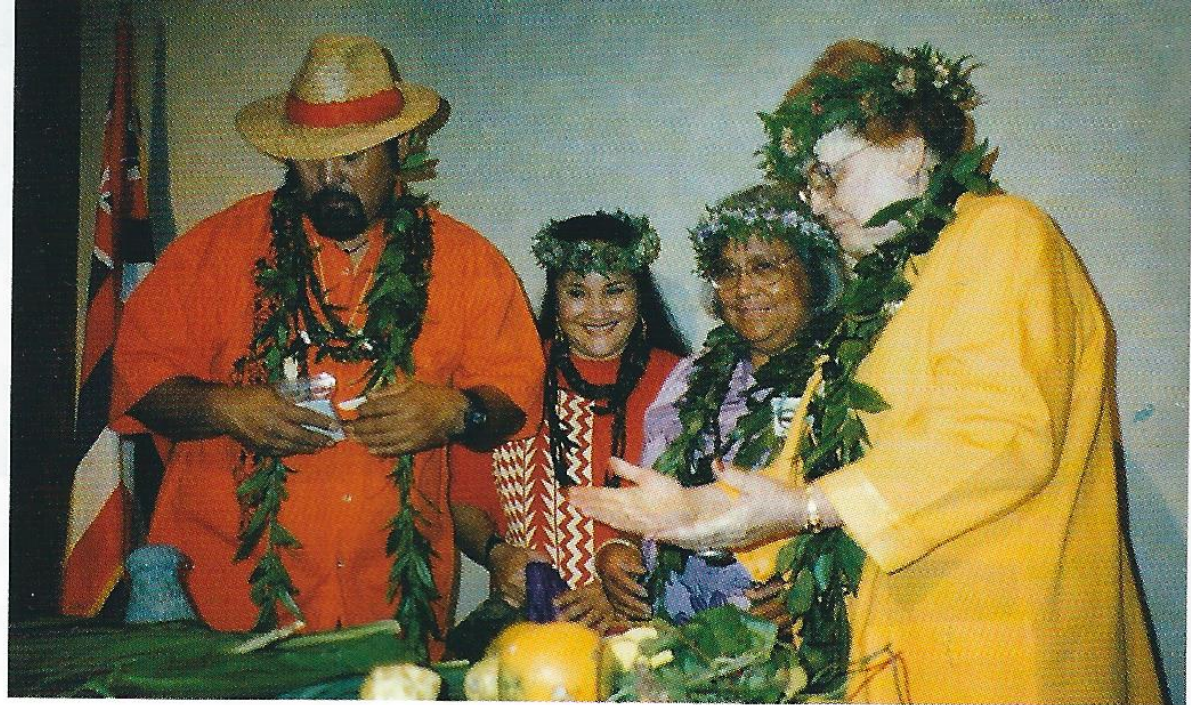
Polynesian traditional healers and carers sharing their knowledge at Transcultural Nursing Conference.