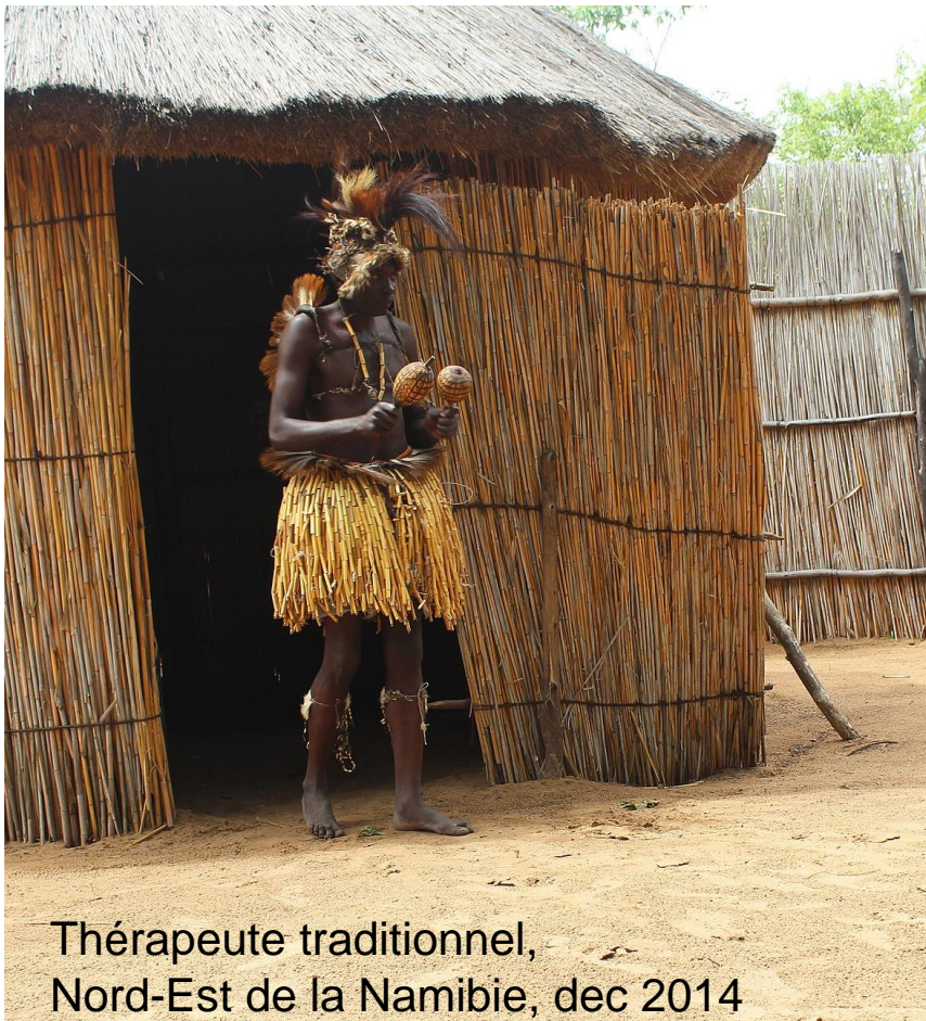
Thérapeute traditionnel, Nord-Est de la Namibie, dec 2014