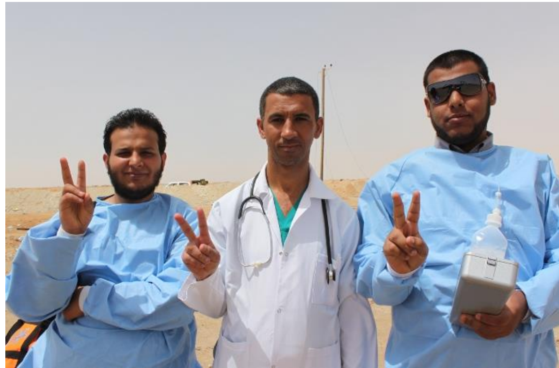
Docteurs sur le front, Lybie Auteur : Al Jazeera English, avril 2011